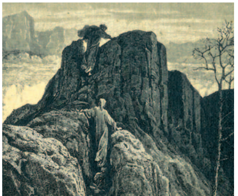
(illustrazione di Gustave Doré)