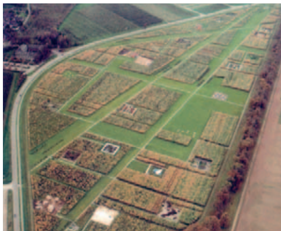
PROGETTO FINALISTA DEL III° PREMIO EUROPEO "ROSA BARBA": "Zentrum für garten kunst und Landschaftskultur Schloss Dyck", Germania; RMP Landschaftsarchitekten, Stephan Lenzen.

*Architetto, è direttore del Dipartimento di Urbanistica e Ordinamento del Territorio dell'Università Politecnica della Catalogna, nonché autore di molti PRG di varie città.