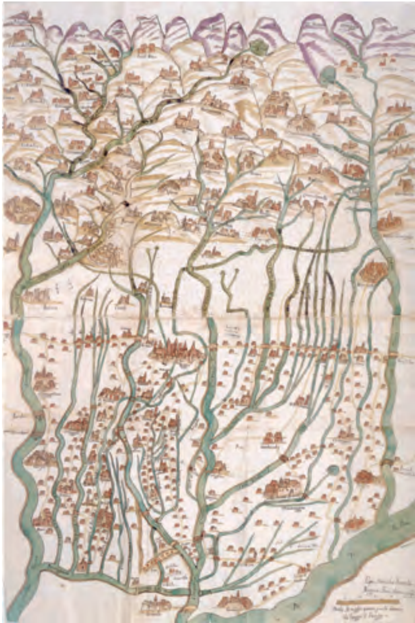
Le immagini di queste pagine sono custodite presso l'Archivio di Stato e la Biblioteca "Panizzi" di Reggio Emilia

L'inventario più chiaro e completo delle forme, sia materiali che immateriali, sia ideali che concrete, che hanno presieduto all'incubazione dell'epoca moderna, e di conseguenza ancora oggi dirigono il corso del nostro rapporto con la realtà. Proprio all'esposizione di tale complesso rapporto è dedicata la mostra "Paesaggi di provincia: cartografia e sintassi del territorio reggiano" che si apre a Palazzo Magnani l'11 novembre.