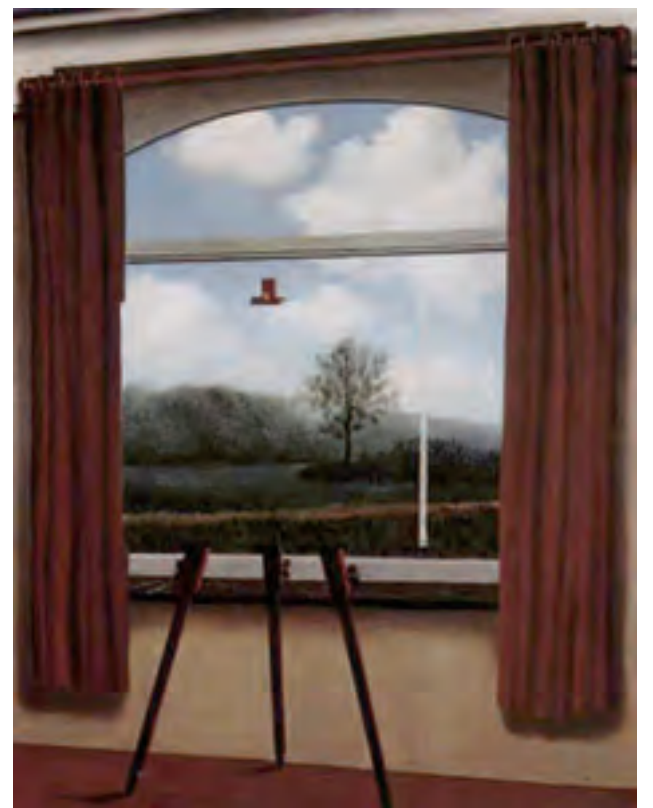
R. Magritte "La condizione umana"

Quando Luigi XIV di Francia fece fare una cartografia completa della Francia, il Re di Spagna, decisamente più povero, provò a fare la stessa cosa. Luigi XIV aveva creato un esercito di cartografi per misurare il paese, mentre Carlo III chiamò il cartografo reale e gli chiese di fare la stessa cosa. L'unica istituzione che in quel tempo poteva coprire capillarmente tutto il territorio spagnolo era la Chiesa, tramite le parrocchie. Ogni parroco fu incaricato di descrivere il paesaggio della propria parrocchia. Ciò è per noi molto interessante. Possiamo vedere quante differenze nella rappresentazione dei paesaggi furono fornite da persone sostanzialmente dotate della stessa formazione: rappresentazioni a 360°, descrizioni ordinate per un percorso, semplicemente idee sparse per il tempo, ecc.. L'idea di poter rappresentare oggettivamente il paesaggio è quindi probabilmente impossibile. Il quadro di Magritte ("La condizione umana") illustra bene come ogni dimostrazione della rappresentazione perfetta, ogni idea di sapere veramente cos'è il paesaggio è impossibile. Apparentemente sembra di stare di fronte ad una perfetta rappresentazione del paesaggio, ma noi in realtà siamo al di fuori: mai potremo "entrare" e toccare con mano il dipinto. Diversi punti di vista dai quali si può avvicinare il paesaggio sono presenti anche nelle grandi famiglie etimologiche esistenti per tale termine. Quella olandese (Landskab) e inglese (Landscape)